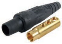
CONECTOR (FEMALE) C/2 PERNOS 400A 600V T/CAM LOCK NEGRO C:1/0-4/0