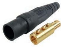
ENCHUFE (MALE) C/2 PERNOS 400A 600V T/CAM LOCK NEGRO C:1/0-4/0