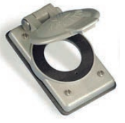
PLACA HERMÉTICA P/TOMACORRIENTE 15 Y 20A INDUSTRIAL