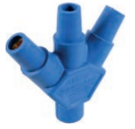
ENCHUFE TRIPLE ENTRADA (MALE/FEMALE) 400A 600V T/CAM LOCK AZUL