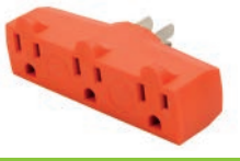
ADAPTADOR CON L/T NARANJA 15A