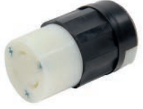
CONECTOR 2X30A 250V L6 C/SEGURO