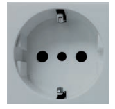
SHUKO 16A 250V SHUKO - BLA SHUKO - MAR