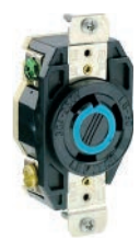
TOMA EMPOTRAR 2X30A 250V L6 C/SEGURO