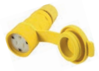
CONECTOR 2X15A 125V L/T A PRUEBA DE AGUA WETGUARD®