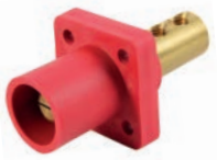
ENCHUFE EMPOTRABLE (MALE) C/2 PERNOS 400A 600V T/CAM LOCK ROJO C:1/0-4/0