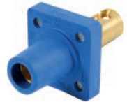
TOMA EMPOTRABLE (FEMALE) C/2 PERNOS 400A 600V T/CAM LOCK AZUL C:1/0-4/0