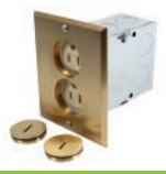
PLACA DOBLE HERMÉTICA PARA PISO - BRONCE