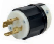
ENCHUFE 3X30A 250V L14 C/SEGURO